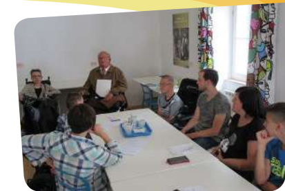
Međunarodni kamp mladih

Posebno značajan je nastavak provođenja međunarodnog Edukacijsko-rehabilitacijskog kampa mladih koji je održan u Rovinju od 15. do 22. srpnja. Na Kampu su sudjelovali mladi s MD i srodnim NMB iz Slovenije, Srbije i Hrvatske te su kroz međusobno druženje i razmjenu iskustava, provođenje rehabilitacijskih i kreativnih radionica nastavili jačati i razvijati suradnju mladih distrofičara u regiji.