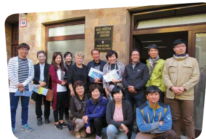
Sastanak s predstavnicima Južne Koreje

Dana 29. rujna 2016., SDDH je ugostio izaslanstvo Južne Koreje kojem je predstavio rad u području unapređenja kvalitete življenja oboljelih od mišićne distrofije i primjenu Konvencije o pravima osoba s invaliditetom u RH.