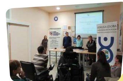
Capacity Building u Udruzi osoba s mišićnom distrofijom Primorsko-goranske županije

Sa članovima Upravnog odbora Udruge distrofičara Virovitica – UD VIR održan sastanak radi razmatranja djelovanja Udruge te je u Udruzi distrofičara Krapina i u Udruzi osoba s mišićnom distrofijom Primorsko-goranske županije proveden Capacity Building za upravljačka tijela udruga.