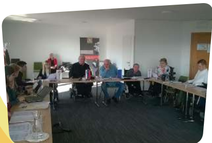
Sjednica Upravnog odbora EAMDA-e