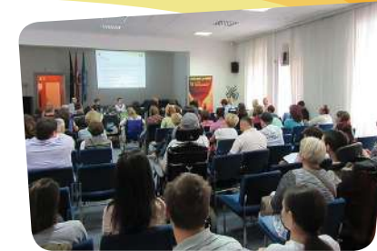
Tribina o položaju osoba s mišićnom distrofijom u RH

Veliko zanimanje izazvale su teme predstavljene na „Tribini o položaju osoba s mišićnom distrofijom u RH“ kojoj su se odazvale i predstavnice resornog ministarstva kao i brojne osobe s invaliditetom. U okviru Tribine predstavljeni su aktualni projekti i rad SDDH.