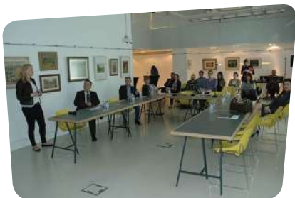
Obilježavanje Svjetskog dana Pompeove bolesti

skupine za razmatranje Nacrta prijedloga Nacionalne strategije izjednačavanja mogućnosti za osobe s invaliditetom 2016. - 2020.