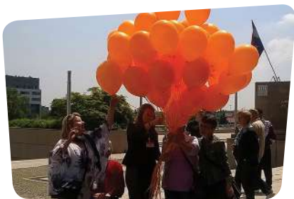
Obilježavanje Svjetskog dana multiple skleroze

obilježavanje 21. ožujka – Nacionalnog dana invalida rada Hrvatske, obilježavanje 40. obljetnice Saveza udruga osoba s invaliditetom Grada Siska, predstavljanje IPA projekta „Puževi koraci“ i Okruglom stolu za izradu Okvira za poticanje i prilagodbu iskustava učenja te vrednovanje postignuća djece i učenika s teškoćama u organizaciji Udruge „Put u život“ – PUŽ, na promociji priručnika „Pas pomagač – od osmijeha do uspjeha“ u organizaciji Hrvatske udruge za školovanje pasa vodiča i mobilitet,