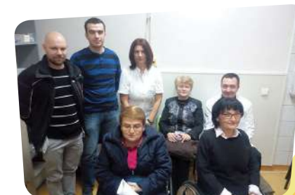
Sastanak s predstavnicima Specijalne bolnice za plućne bolesti