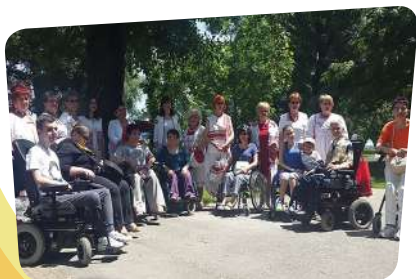
Humanitarna likovna kolonija Društva distrofičara Zagreb

Dan otvorenih vrata Društva distrofičara Zagreb i Saveza društava distrofičara Hrvatske, bio je posebno posvećen značaju korištenja uređaja za iskašljavanje u očuvanju respiratornog sustava kod oboljelih od MD i srodnih NMB i značajnoj ulozi u stimuliranju kašlja i izlučivanju sekreta.