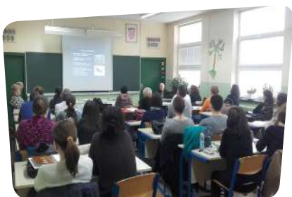
Edukacija u OŠ Lučko

Tijekom 2016. godine, održano je šest sastanaka koordinacijskog tijela Centra znanja za društveni razvoj u području unapređenja kvalitete življenja osoba s invaliditetom koje je vodio SOIH kao krovna organizacija. Na sastancima su razmatrana pitanja financiranja i aktivnosti saveza osoba s invaliditetom.