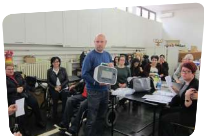
Dan otvorenih vrata Društva distrofičara Zagreb i Saveza društava distrofičara Hrvatske

Uz spomenute aktivnosti, predstavnici SDDH sudjelovali su na edukacijama za osobne asistente i korisnike usluge osobne asistencije koje su održane tijekom 2016. u: Kutini, Slavonskom Brodu, Varaždinu, Zadru, Karlovcu, Osijeku, Čačincima, Virovitici, Rijeci, Vukovaru, Đakovu, Orahovici, Požegi, Čakovcu, Loboru, Zaboku, Senju, Gračacu, Samoboru, Sinju, Kaštelima, Trogiru, Splitu, Omišu, Makarskoj, Metkoviću, Dubrovniku, Križevcima, Koprivnici, Đurđevcu, Bjelovaru, Puli, Slatini, Daruvaru, Kninu i Šibeniku.