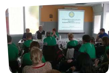
Obilježavanje 5. svibnja - nacionalnog dana osoba s cerebralnom paralizom

Predstavnici SDDH sudjelovali su na brojnim okruglim stolovima i drugim događanjima povodom obilježavanja važnih datuma, obljetnica djelovanja: na okruglom stolu povodom obilježavanja 8. ožujka – Međunarodnog dana žena i Europske godine protiv nasilja nad ženama i djevojčicama u organizaciji Zajednice saveza osoba s invaliditetom i Pravobraniteljice za osobe s invaliditetom te na okruglom stolu „Prevenција nastanka invalidnosti“ povodom obilježavanja 21. ožujka – Nacionalnog