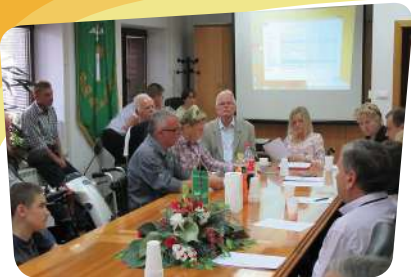
Redovna Skupština Udruge distrofičara Krapina

Predstavnici SDDH su tijekom 2016. sudjelovali na različitim aktivnostima koje su organizirale udruge članice: na Sjednici Redovne skupštine Udruge distrofičara Virovitica, na obilježavanju 30. godišnjice rada Društva distrofičara, invalida cerebralne i dječje paralize i ostalih tjelesnih invalida Čakovec, na Redovnoj godišnjoj skupštini Udruge osoba s invaliditetom Krapinsko-zagorske županije i Redovnoj skupštini