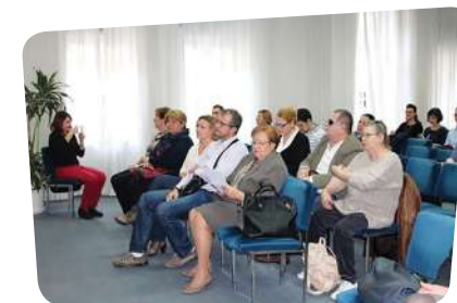
Okrugli stol Medijska reprezentacija OSI