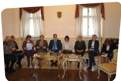
Prijem predstavnika nacionalnih saveza u Skupštini Grada Zagreba

podnošenje prijava na Javni poziv za sufinanciranje programa i projekata, na raznim konferencijama: konferenciji povodom Međunarodnog dana zadruga organizaciji Hrvatskog centra za zadržano poduzetništvo i Grada Zagreba, ATAAC – Konferencija o asistivnoj tehnologiji i potpomognutoj komunikaciji u organizaciji E-Glasa.