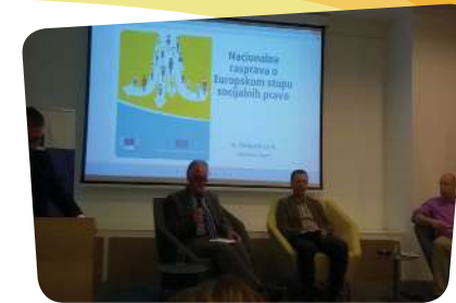
Nacionalna rasprava o Europskom stupu socijalnih prava

SDDH je sudjelovao na informativnim radionicama: „INFO dan o Europskom socijalnom fondu“ u organizaciji Zagrebačke županije i Ministarstva rada i mirovinskog sustava na skupu „Poticanje društvenog poduzetništva“ u sklopu Operativnog programa Učinkoviti ljudski potencijali 2014. - 2020. također u organizaciji Ministarstva rada i mirovinskog sustava, „Radionica planiranja za 2017. i druge aktualnosti“, na radionici Zaklade „Hrvatska za djecu“ vezano za