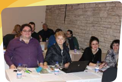
Sastanak Centara znanja u Zadru

SDDH je tijekom godine nastavio suradnju s Nacionalnom zakladom za razvoj civilnog društva (NZRCD) te je početkom godine potpisan Sporazum o Razvojnoj suradnji u području Centara znanja za društveni razvoj u području unapređenja kvalitete življenja osoba s invaliditetom. Predstavnici SDDH sudjelovali su na sastanku predstavnika nacionalnih saveza, drugih Centara znanja i predstavnika Nacionalne zaklade za razvoj