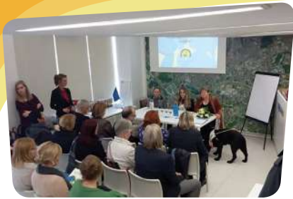
Promocija priručnika „Pas pomagač – od osmijeha do uspjeha“

obilježavanje 21. ožujka – Nacionalnog dana invalida rada Hrvatske, obilježavanje 40. obljetnice Saveza udruga osoba s invaliditetom Grada Siska, predstavljanje IPA projekta „Puževi koraci“ i Okruglom stolu za izradu Okvira za poticanje i prilagodbu iskustava učenja te vrednovanje postignuća djece i učenika s teškoćama u organizaciji Udruge „Put u život“ – PUŽ, na promociji priručnika „Pas pomagač – od osmijeha do uspjeha“ u organizaciji Hrvatske udruge za školovanje pasa vodiča i mobilitet,