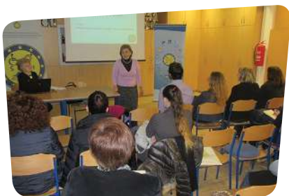
Edukacijski seminar o pristupačnosti

SDDH je sudjelovao i u radu XXI. hrvatskog simpozija osoba s invaliditetom i na edukacijskom seminaru o pristupačnosti u organizaciji Zajednice saveza osoba s invaliditetom Hrvatske,